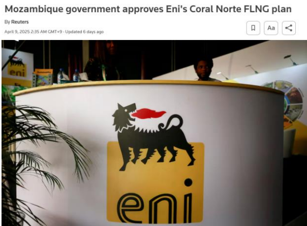
그림 4. 4월 9일 모잠비크 정부의 코랄 노스 가스전 72억달러 투자 승인, 삼성중공업 ENI Coral #2 FLNG 수주 가시화