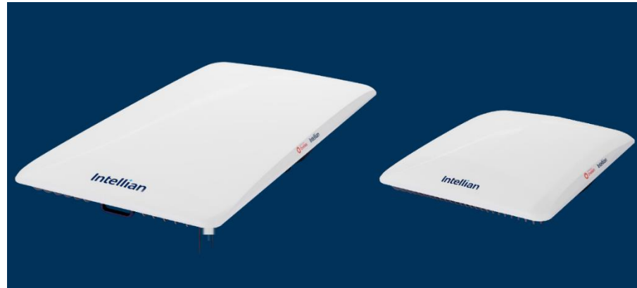
도표 6. 원웹향 평판형 안테나(OW11FL, OW10HL)