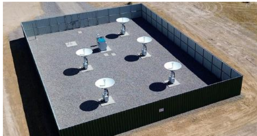
도표 7. 게이트웨이 안테나