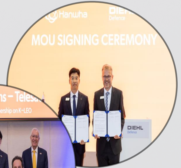
사업 협력 관련 MOU