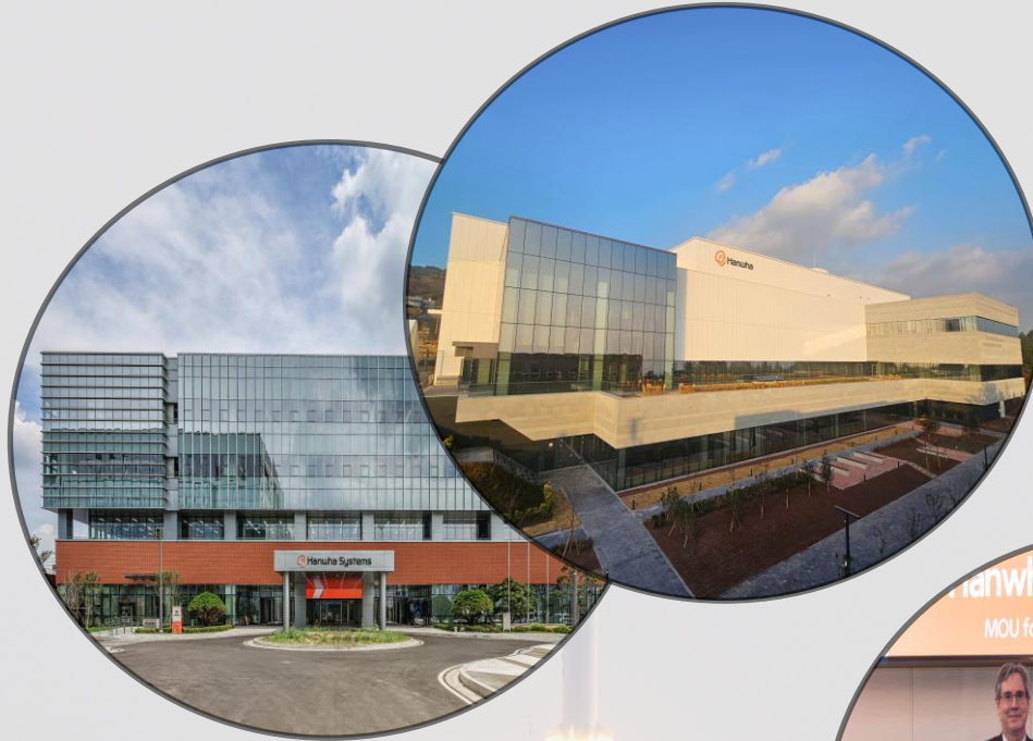
구미 신공장 / 제주 우주센터 개소