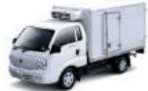
전기 냉장 트럭