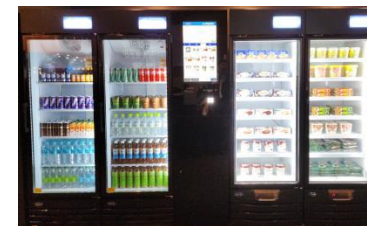
AI 무인스토어 솔루션