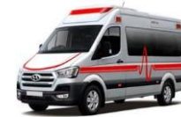
감염병 음압 특수 구급차