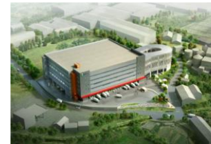
GS리테일 경산 물류센터 냉동/냉동 시스템