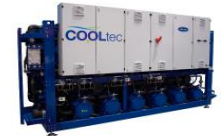
자연냉매 냉동기 (CO2, R290, R600a)