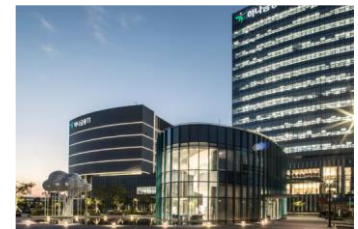
하나금융그룹 통합데이터센터 원심 냉각기