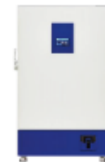
초저온 냉동고 (-60도 ~ -90도)