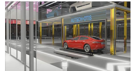
오토발렛 기계식 주차 설비