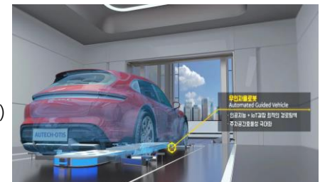
인공지능 주차로봇 솔루션