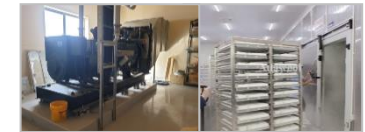
스마트 온도관리 시스템 창고온도/냉동기 운전상태 리얼타임 감시