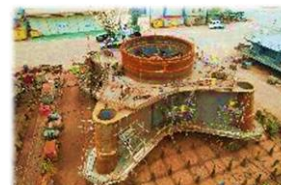
('23.01 ~ '23.12 Hibikinada, T/P 外)