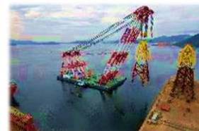
('21.12 ~ '25.04 Hailong, 58JKT)