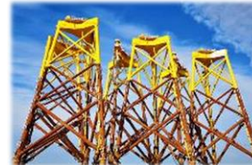
('21.12 ~ '23.03 Zhongneng, 15JKT)