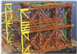
('15년 Caligali BCP Jacket)