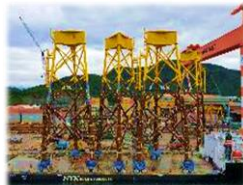
('20.06 ~ '23.08 Bladt, 30JKT)