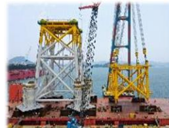
('20.07 ~ '21.03 Orsted 20JKT)