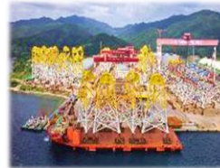
('19.12 ~ '22.06 Orsted, 59JKT)