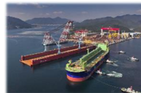
('21.04 ~ '23.11 Barossa FPSO)