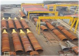
('15년 Ichthys Driven Piles)