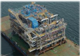
('16년 Ichthys Top-side Module) ('16년 Badamyar JKT & Pile)