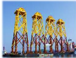
('19.07 ~ '20.05 JDN, 21JKT)